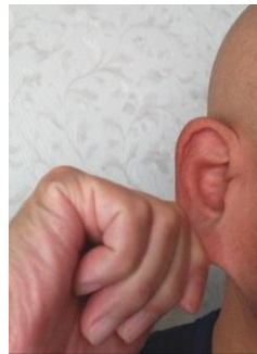
耳の周囲を引っ張る